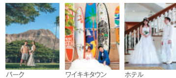
パーク ワイキキタウン ホテル

※30分延長35カット追加となります。※リクエストベースとなります。※ホテル撮影は宿泊ホテルに限ります。※ホテルにより必要泊数や許可申請方法・別途の撮影申請料の有無が異なりますのでお問い合わせください。※撮影教会・ご宿泊ホテル・挙式の有無により料金は変動します。※追加撮影分に併し他オプション料金が変動することがあります。